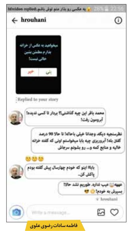
فاطمه سادات رضوی علوی