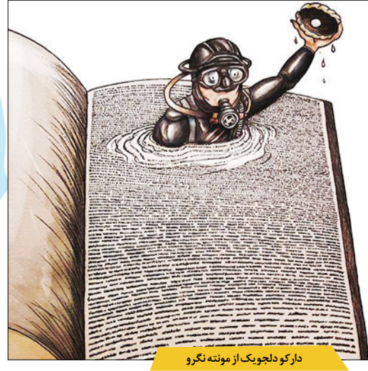
دارک دلجو بیک از مونه نگر

به یکی از کافی شاپ های سطح شهر رفتیم تا نظر روشنفکران جامعه را در مورد حمله های اخیر به ۲ روحانی بیگناه، جوایا شویم. یک بانوی سیگار به دست گریبان ادرجالی که آب بینی اش را نگه داشته است! بیخسید که حال خوب نیست، طفلی آناستازیا... گربه ملوس بود، با شاسی بلند دنده عقب رفتن روش، کنتل شد... نه اینکه عمدی باشه! اتفاقاً من بعداً با خشونت مخالفم. توی جامعه هر کسی باید آزاد باشه هر عقیده ای داشته باشه. همون دیشب داشتم کمپین #free_chaghoo_kesh می داشتم که طفلی آناستازیا رو... آگه دادگاه این دو نفر رو تبرئه نکنه، رژیم با موجی از هشتگ ها رو به رو خواهد شد! محکم فین می کند!