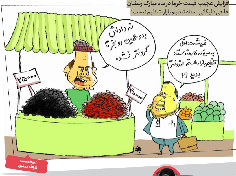
افزایش عجیب قیمت خرما در ماه مبارک رمضان حاجی دلیگانی: ستاد تنظیم بازار، تنظیم نیست!

ضمیمه طنز راه راه سازمان فرهنگی و تبلیغاتی راهراه.ir @tanzym