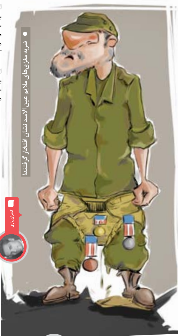
ضربه مغزی‌های ملالیم عین‌الاسدی نشان اختصار گرفتند!

شرکت پساکرونا اندیشان در نظر دارد تعداد نامحدودی خودرو، مسکن و... را به قیمت قبل از کرونا عرضه کند. اطلاعات تکمیلی بعداً. ستاد مبارزه با کرونا، واحد کاهش استرس، بخش کاب. که (کی به کیه)