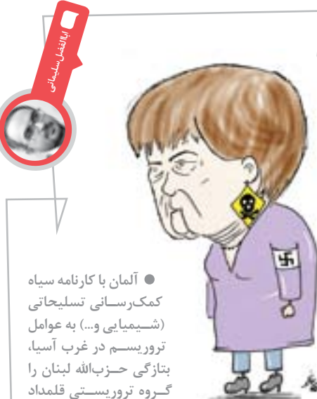
آلمان یا کارنامه سیاه کمکرسانی تسلیحاتی (شیمیایی و...) به عوامل تروریسم در غرب آسیا، بتازگی حزب‌الله لبنان را گروه تروریستی قلمداد کرده است!

شاعران با کافه تا افتاد کار و بارشان کافه‌ها از انجمن‌ها سکه شد بازارشان کافه تازیک است و اینها زود شاعر می‌شوند بوی دود و قهوه دارد آروغ افکارشان تا فضای کافه را بسیار عرفانی کنند شعر نرم‌افزارشان، سیگار سخت‌افزارشان غالباً چون در فضای مختلط شاعر ترند دلبری دارند با ابیات از دلدارشان حافظ و سعدی فقط در حد فال است و دکور بخشی از شاعر فراری‌ها سوپرستارشان هر چه نامفهوم‌تر، احسن‌هایش بیشتر گه‌گذاری فحش دارد شعر لاکردارشان خوانش اشعارشان مثل پنیر پیترزاست کش می‌آید واژه‌ها در لهجه کش‌دارشان فلسفه در لایه‌لای بیت‌ها قاطی شده روح اگرستانسیالیسمی است در اشعارشان اکثراً زن‌ها رمانتیسند و مردان سوررئال هست ظاهر در کت و در مانتو و شلوارشان آنقدر فاز هنر دارند در خود، گویا صوت داوودی برون می‌آید از گیتارشان چون که خیلی فلسفی هستند، پس حسن ختام کافکا و نیچه و صادق هدایت یارشان