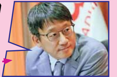
قائم مقام سفیر کره جنوبی در تهران