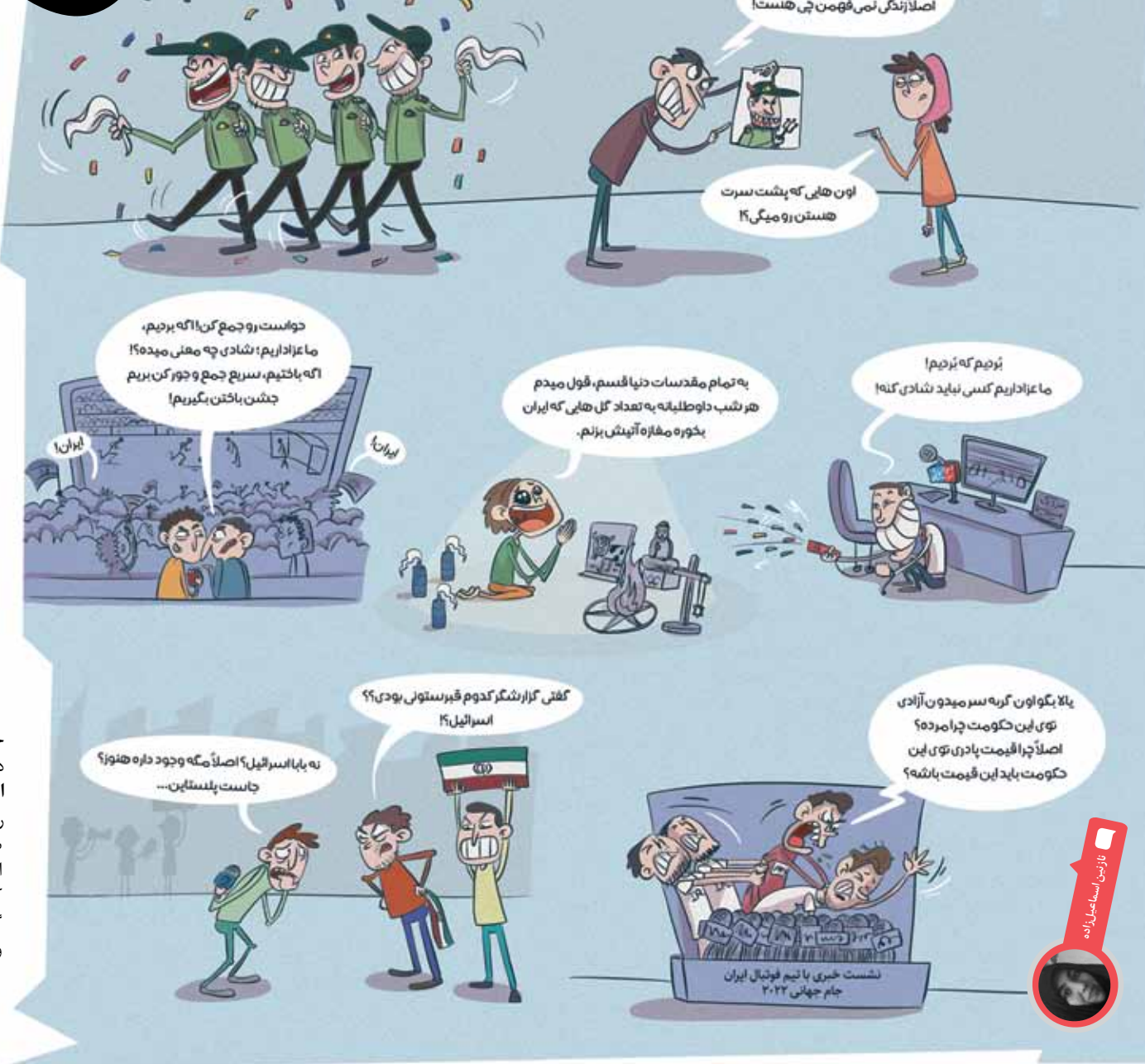
تازمین ساجدی زاده