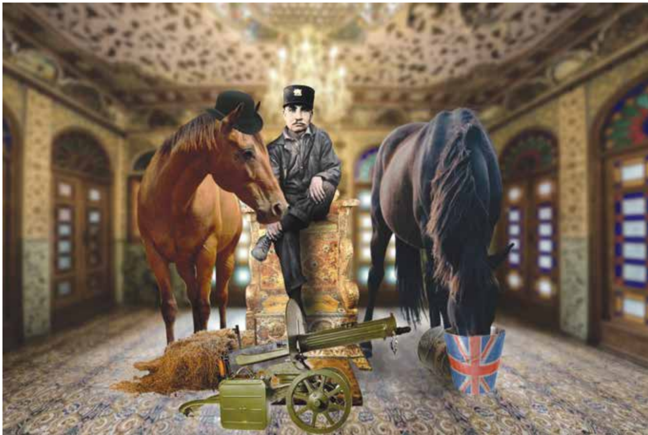
طراح: سید مهدی موسوی

وی در اقدامی حکیمانه و شجاعانه سید ضیاءالدین را نخست وزیر و رضاخان را وزیر جنگ کرد تا غائله کودتا ختم به خیر شود. انگلیسی ها که دیدند احمدشاه با چسب یک دو سه به صندلی سلطنت چسبیده، کم کم او را آماده کردند. اولش گفتند قاجار باید برود آمپول بزند، بعد گفتند رضا آمپول را بزند، بعدتر گفتند قاجار به کما رفته و رضا چون خوب آمپول زده از خان به شاه تبدیل شود. و اینگونه بود که قاجار برداشته شد و پهلوی سر کار آمد.