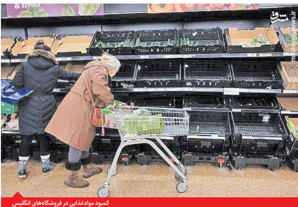
کمبود مواد غذایی در فروشگاه های انگلیس

۹) سعی کنید گوشت و لبنیات و میوه جات و سایر «جات» ها را از سید خانواده ها حذف کنید و به جایش ماشین ظرفشویی و فرش شوکران و هود بادکش و میل دسته طلا و یخچال دودر را تبلیغ کنید.