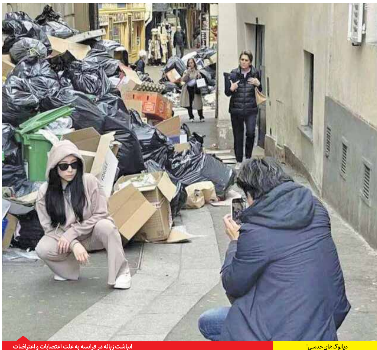
انباشت زباله در فرانسه به علت اعتصابات و اعتراضات