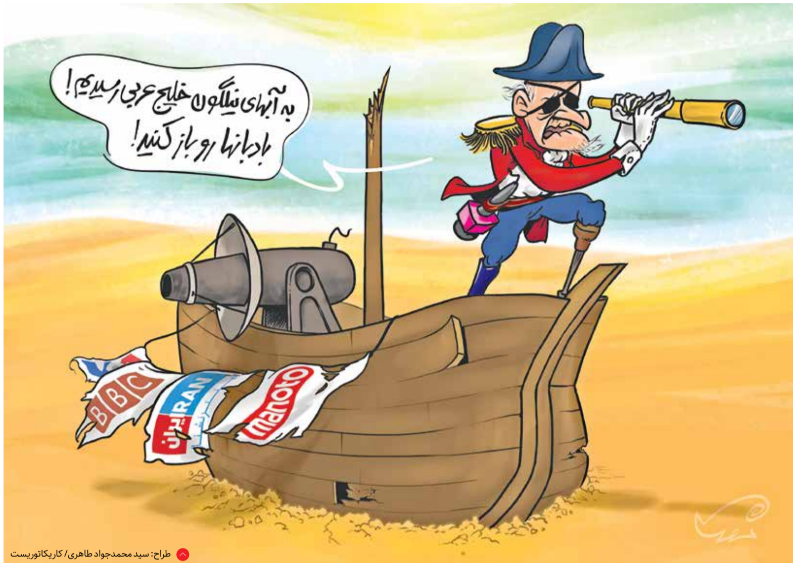
طراح: سید محمدجواد طاهری / کاریکاتوربست

بابا لنگ دراز بانمک من، الان حتماً می‌پرسید جودی کی ازدواج کرد که حالا باید در صف تاریخ ژند برای زایمان بایستد. در جواب باید بگویم که جودی شما هنوز ازدواج نکرده ولی از آنجا که امکانات ما در اینجا خیلی کم است و به ندرت تاریخ ژند پیدا می‌شود، باید حالا که یک تاریخ ژند پیدا شده دست به کار شوم و آن را برای زایمان خودم رزرو کنم. خوشبختانه ساعت سه و نیم صبح که خانم ترون از صدای جیغ من، وحشتزده از خواب پرید و به داخل اتاق هجوم آورد، متوجه شدم که سالی و جولیا هم همین فکر را با خودشان کرده‌اند و قرار گذاشتیم با هم به صف تاریخ برویم. جولیا معتقد است الان تاریخ را رزرو کنیم، تا آن موقع، شوهر و بچه‌اش هم می‌رسد. البته جولیا با این موضوع مشکلی ندارد چون اگر تا آن روز هم ازدواج نکرده باشد و بچه‌ای در شکم نداشته باشد، پدرش می‌تواند با یک تلفن به رئیس بیمارستان، آنها را وادار کند تا بچه جولیا را در تاریخ ژند مورد نظر به دنیا بیاورند. اما من و سالی چنین امکانی نداریم. سالی می‌گوید اگر خودم تا یک ماه دیگر بچه‌دار شدم که هیچ اما اگر نشدم، می‌توانم تاریخ را در بازار آزاد بفرشیم و در سامانه یکپارچه خودرو ثبت‌نام کنم و همین‌طور ادامه بدهم تا بلکه بتوانم با همسر آینده‌ام یک زیرشیراوی دور از برج ایفل اجاره کنیم. اما من خیلی امیدوار نیستم چون حتی اگر بتوانم خودرو با سهمیه فرزندآوری ثبت‌نام کنم باز هم باید ۶ ماه صبر کنم تا شاید خبری شود و تا آن موقع، جرویس پندلتون صدبار ازدواج کرده و شما باید هزینه خرید یک خمره پلاستیکی را علاوه بر هزینه‌های جراحی زیبایی که به تازگی پرداخت کرده‌اید، پرداخت کنید. امضا: جودی ناامید