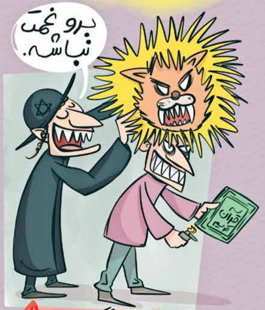
فرایند سیر کردن افراد توسط مویش های در حال انقراض