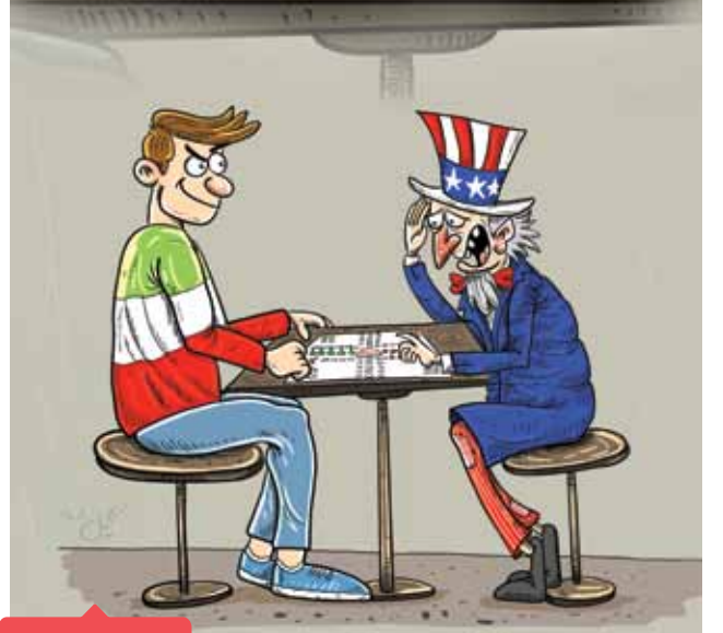
سجاد کیل پور محسنی