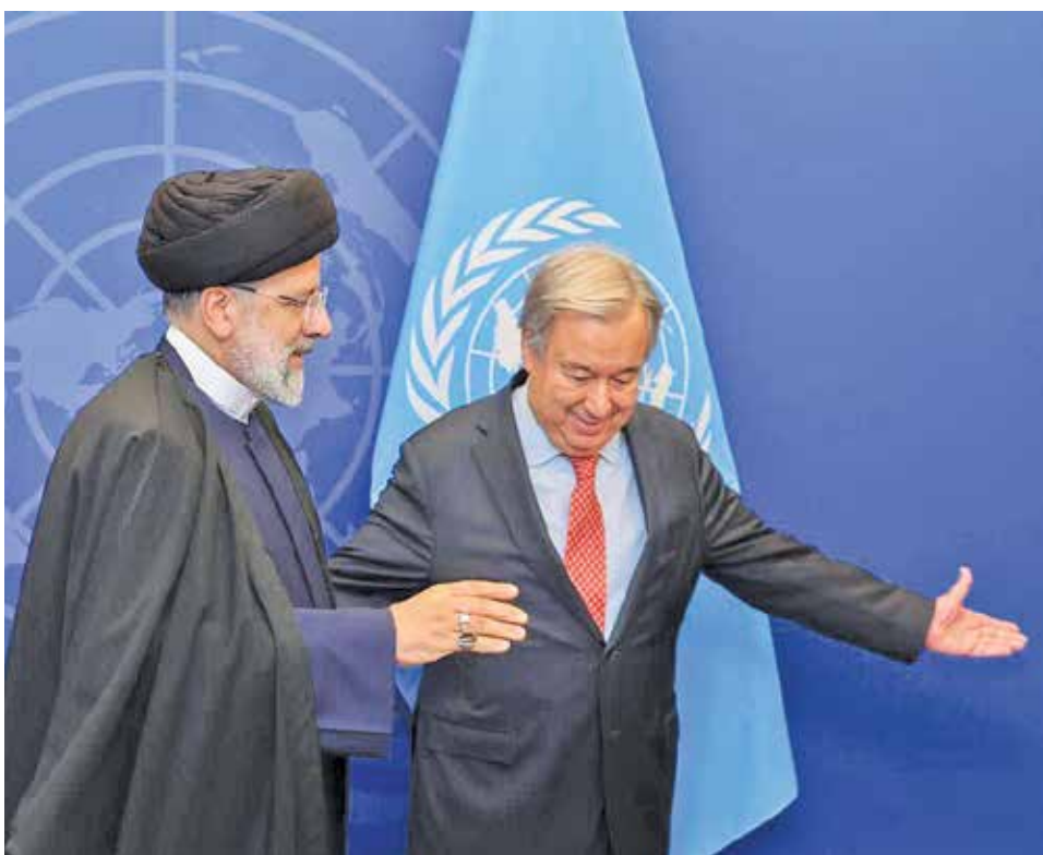
دیا لوگ حدسی

دبیرکل: اینجا باید سخنرانی کنید جناب رئیسی. رئیس: ولی من سخنرانی نمی کنم می خوام مثل بولدزر از روی استکبار رد بشم.